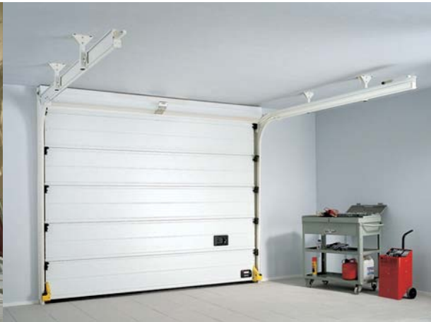
MOD. HORIZON XT